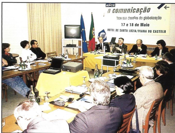
A apresentação das experiências havidas em vários sectores empresariais da região de Viana acrescentou interesse às comunicações