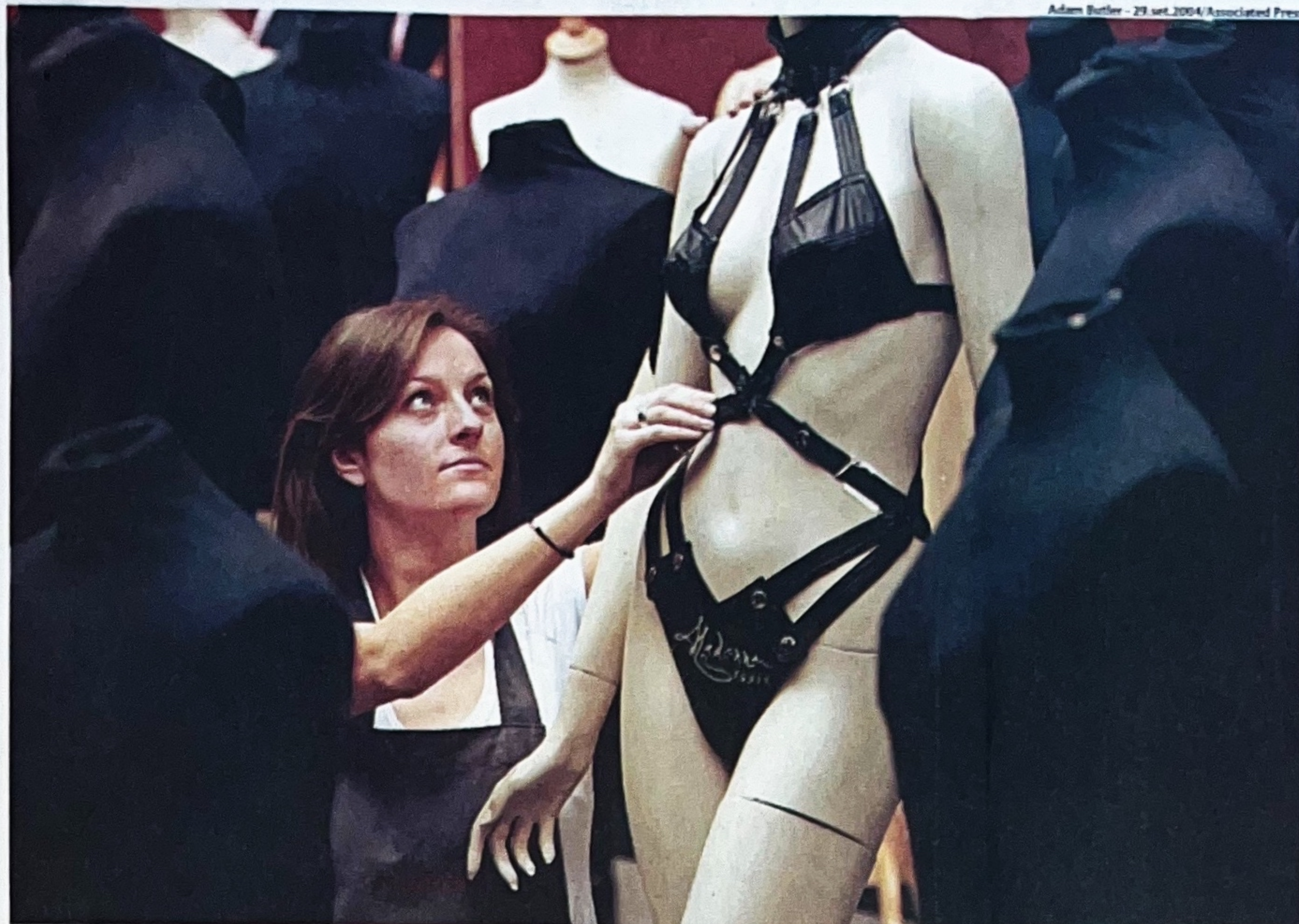
Funcionária da casa de leilões Christie's, em Londres, arruma vestimenta de couro usada por Madonna em seu livro "Sex" (1992)