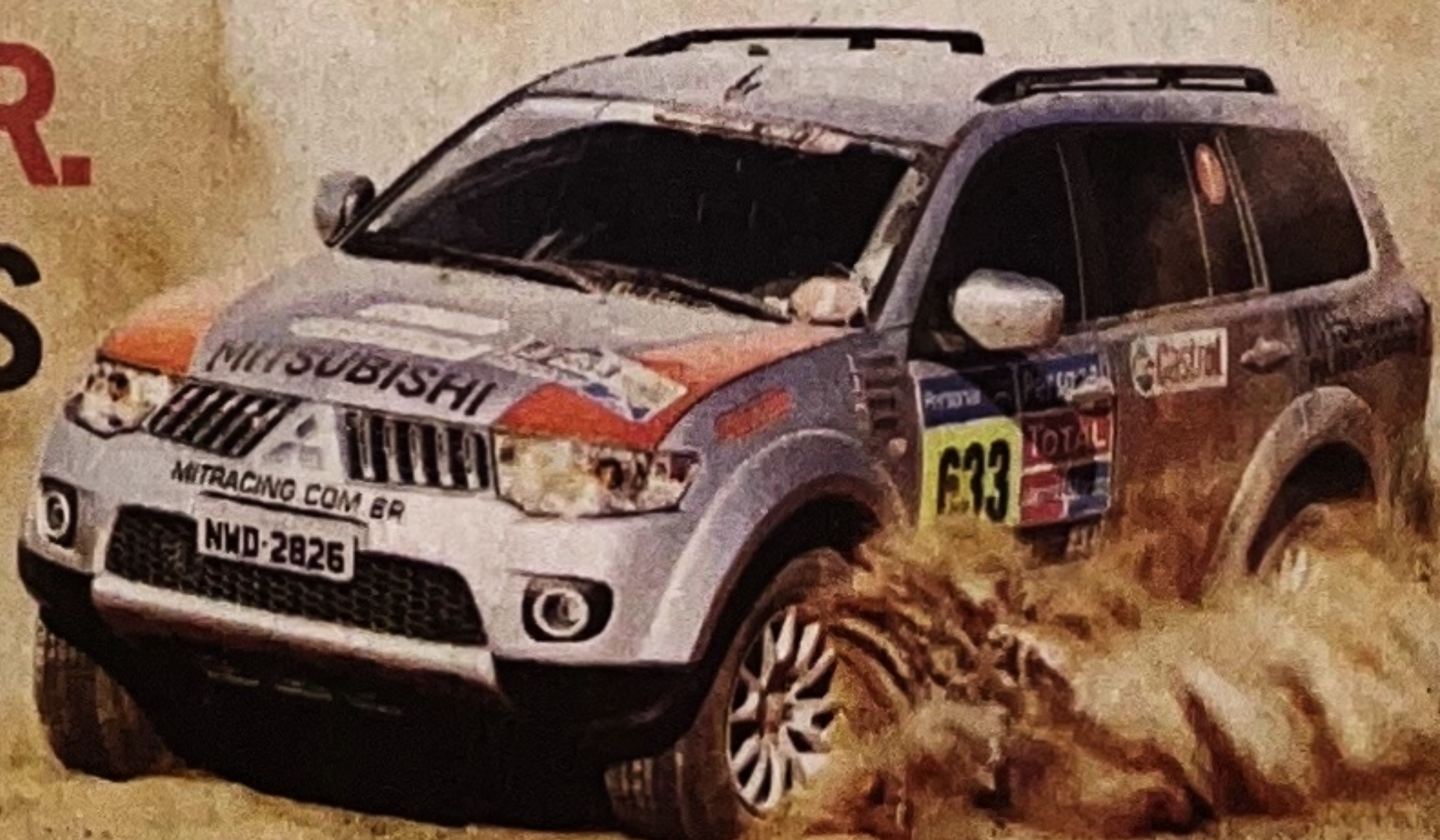
Foto tirada durante o Rally Dakar 2011. Mitsubishi Pajero Dakar, o carro que você vê nas ruas dando apoio à equipe Mitsubishi Brasil.

MITSUBISHI PAJERO DAKAR. DAS AREIAS MAIS DIFÍCEIS DO MUNDO, PARA A SUA GARAGEM.