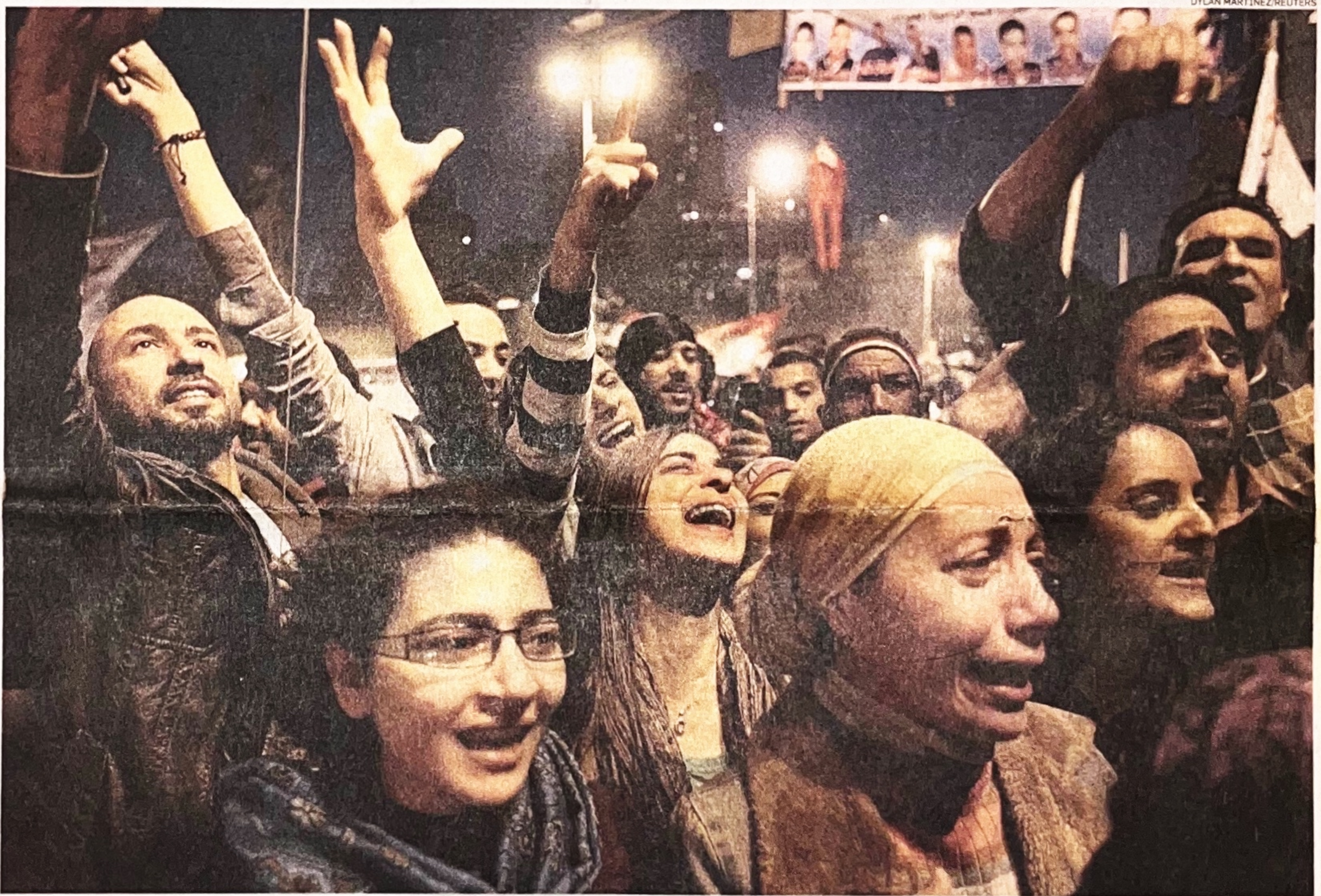
Celebração. Manifestantes festejam a renúncia de Hosni Mubarak na Praça Tahrir, no Cairo: notícia foi recebida com mistura de euforia e incredulidade

Por décadas Mubarak foi ridicularizado. Mas o talento egípcio para a sátira se tornou uma arma agressiva de dissidência política. INTERNACIONAL / PÁG. A20