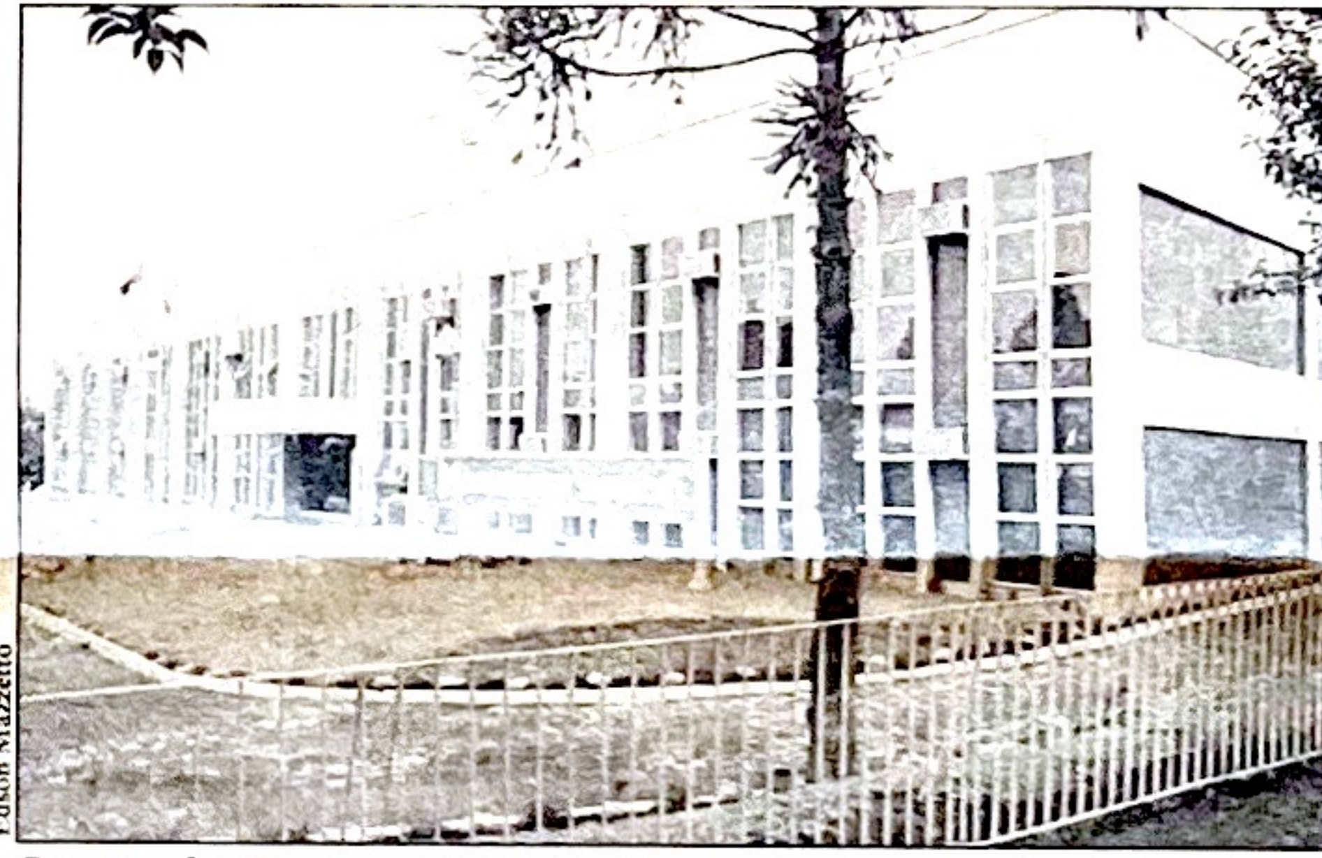
Bamerindus Seguros em Cascavel: reengenharia e produtividade

As Regionais de Londrina (PR), Porto Alegre (RS) e Goiânia (GO) foram as primeiras a contar com